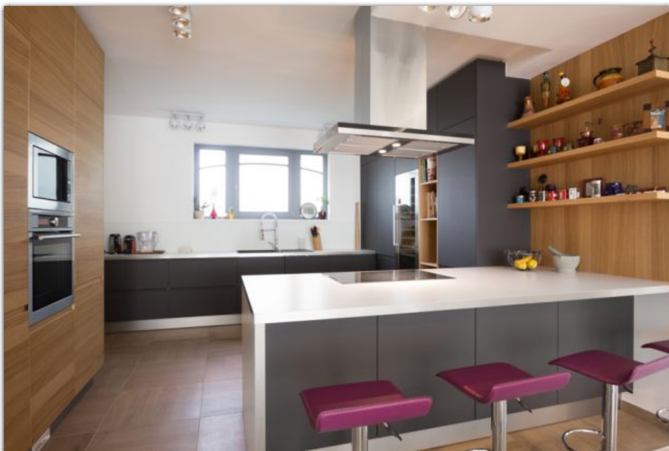
Konyha és étkező egy térben

A megrendelő igénye szerint a konyha egybe lett nyitva az étkezővel, hogy a pult mellé leülő gyerekek vagy vendégek együtt tudjanak lenni a konyhában tevékenykedővel. Az anyagokat úgy válogattuk ki, hogy illeszkedjenek a többi berendezéshez, emellett praktikusak legyenek és könnyen tisztíthatóak.