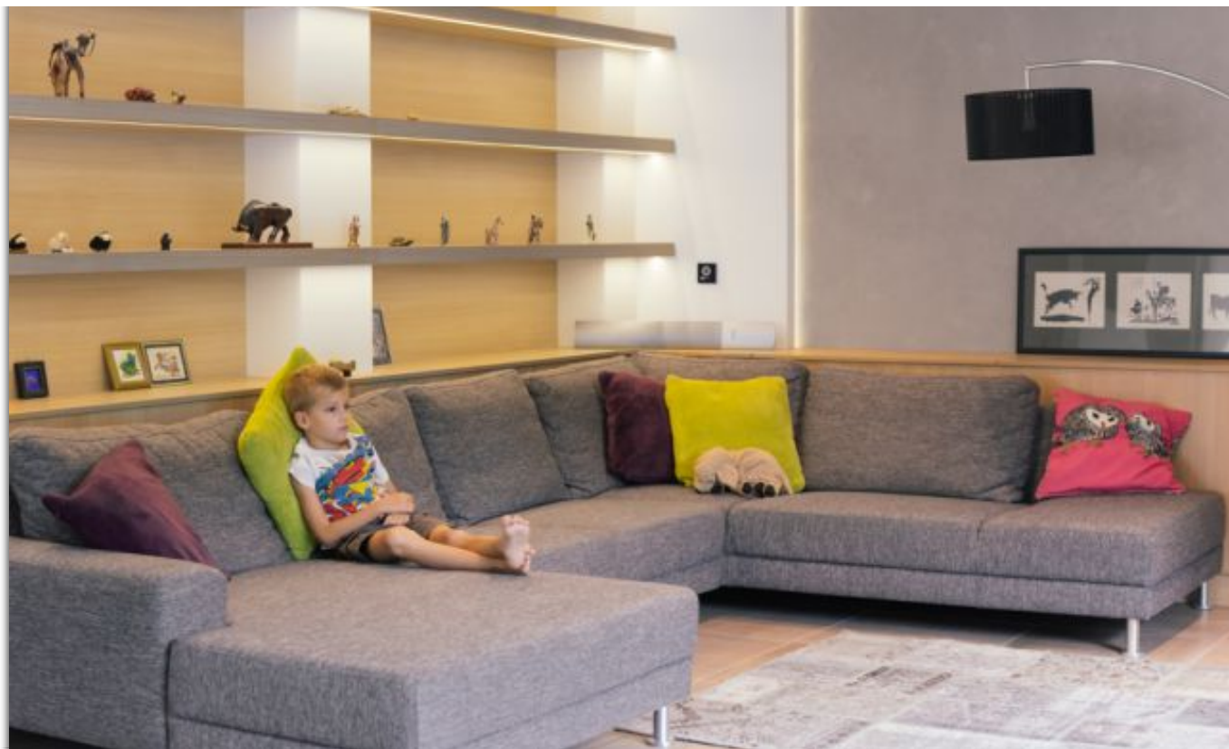
Tágas nappali kényelmes pihenő sarokkal