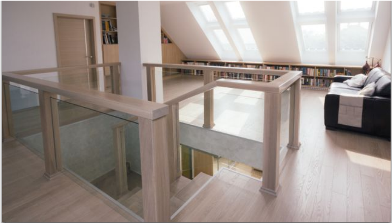
Felső szinten a szülői és gyermek intim terek

A gyerek fürdőszoba színvilága egyértelművé teszi, hogy fiúknak készült, úgy rendeztük be, hogy öt év múlva is tetszen nekik. A két fiú állandó versenyben áll egymással, ami szinte egyforma berendezést kívánt volna. A közös játszórész a földszinten kapott helyet, az emeleti szobákban a könnyű átalakíthatóságra törekedtünk, hiszen a fiúk jelenleg abban a korban vannak, amikor félévente változik, hogy éppen mi tetszik nekik. Szobáik kialakításánál ezért a drága berendezés helyett könnyen cserélhető dekorációs anyagokat használtunk.