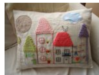
Ha szereted a kézimunkát, gyereked alkotását át is konvertálhatod akár így is 😊