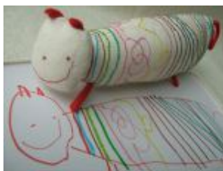
Gyerekrajzos alvóka 😊