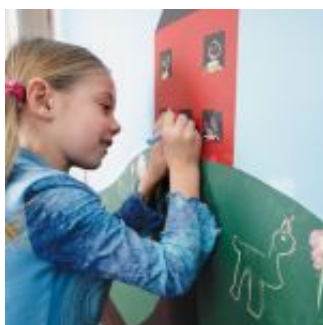
Színes, karakteres krétafal, ha unod az egyszerű feketét.