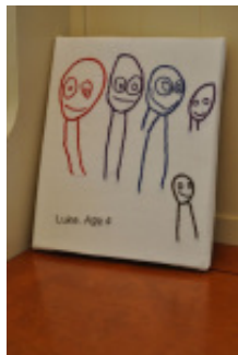
Ütős ajándék lehet egy ilyen hímzett kép.