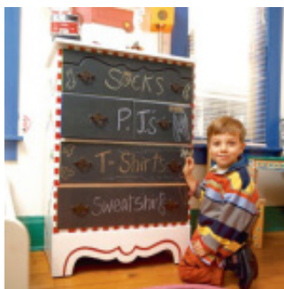
Így akár saját maga lehet a dekoratőr 😊