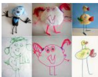
3D-be átültetett rajzok.