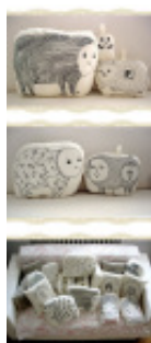
Egyszerű vonal rajzokkal díszített párnák.