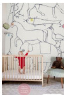
Gyerekrajzra hajazó grafika a babaszobában biztosan találó dekoráció.